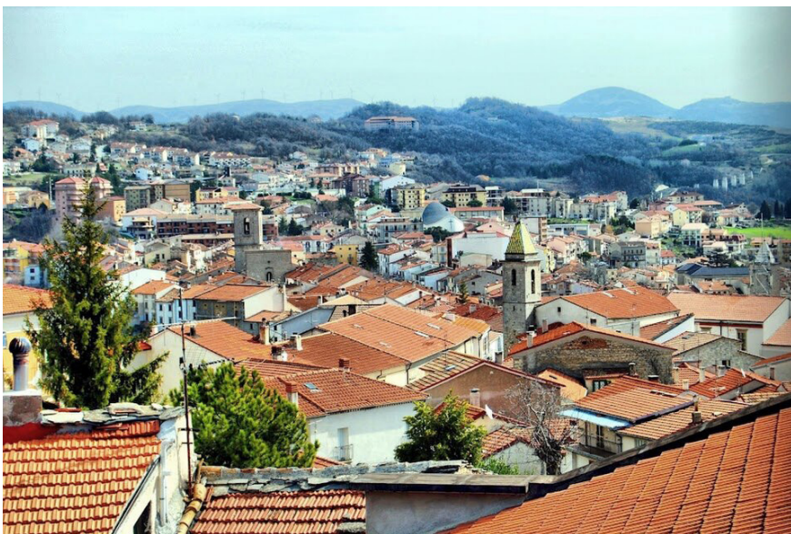
Veduta parziale di Agnone del Molise,

dal centro storico verso i nuovi quartieri nati nel corso del 20° secolo.