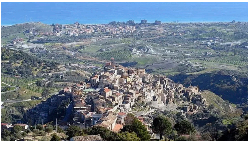
Badolato (CZ), in riva alla Calabria jonica centrale.